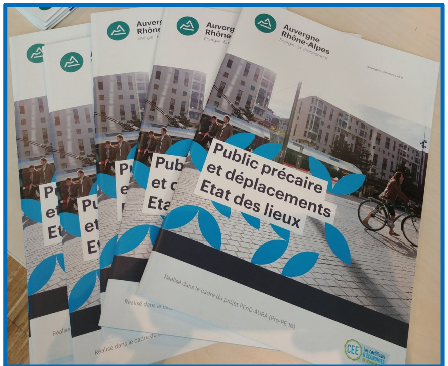
Plusieurs exemplaires du rapport « Public précaire et déplacements – Etat des lieux »

Responsable du pôle Transports et mobilité du département CEE, Total Marketing France